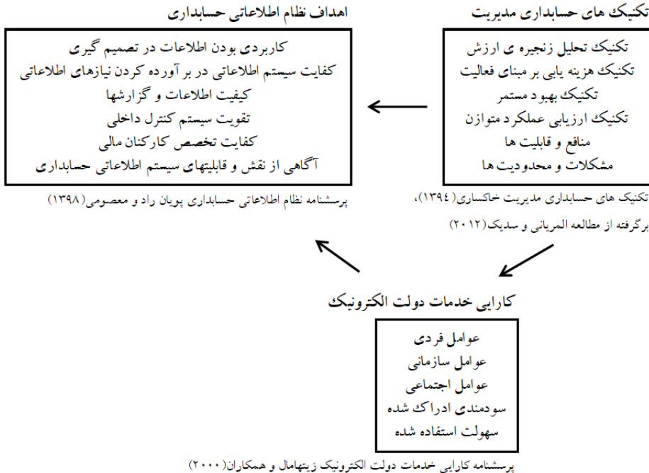
شکل ۱. مدل مفهومی پژوهش (برگرفته از مطالعه‌ی حداد و آل‌سید (۲۰۲۱) و سایر مطالعات)

از مطالعه‌ی حداد و آل‌سید (۲۰۲۱) و سایر مطالعات، با بررسی محتوای پژوهش‌ها، پس از أخذ دیدگاه صاحب‌نظران و اساتید خبره، مدل مفهومی شکل ۱ مورد تأیید برای استفاده قرار گرفت که در آن، تکنیک‌های حسابداری مدیریت و ابعاد شش‌گانه‌ی آن، به عنوان متغیرهای مستقل، کارایی خدمات دولت الکترونیک به عنوان متغیر میانجی و اهداف نظام اطلاعاتی حسابداری به عنوان متغیر وابسته در نظر گرفته شده‌است.